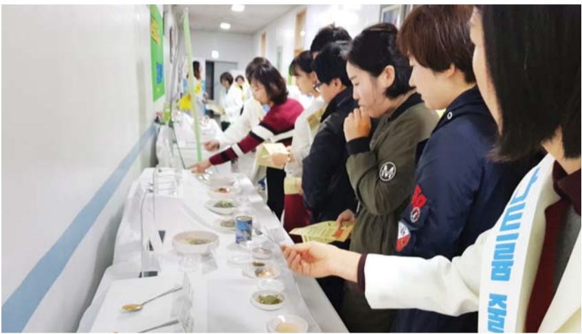
전남도는 지난달 26일부터 2주 동안 강진의료원 및 함평군청 2곳의 직장인과 도민을 대상으로 '직장인 나트륨 줄이기 실천 홍보 릴레이 캠페인'을 실시했다.