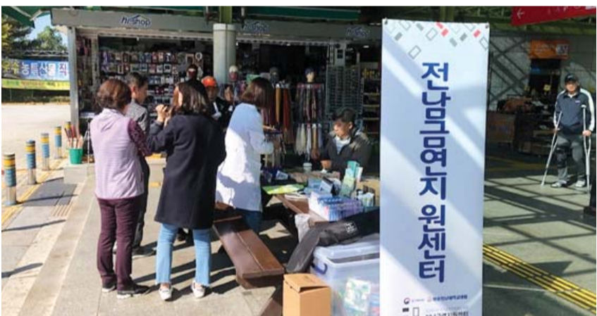
안국산업(주) 곡성(논산)휴게소·주유소는 최근 전남금연지원센터와 함께 휴게소 방문객을 대상으로 금연캠페인을 진행했다. 이번 캠페인에서는 일산화탄소 측정체험, 폐활량 측정, 금연 전문가 상담 등이 진행됐다.