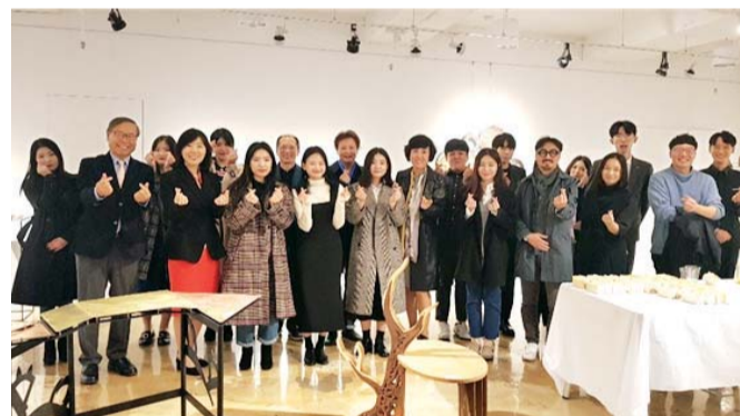
과 실무능력을 향상시키기 위해 중소벤처기업부 창업진흥원에서 주관하는 창업·취업 프로그램을 운영 하고 있다. 졸업 후 진로는 보석감정사, 중등 2급 정교사, 주얼리디자이너, 문화상품디자이너, 주얼리 CAD, 금속장신구 공예가, 주얼리 마스터, 주얼리 코디네이터, 상품기획 및 유통 등 다양한 분야로 진출하고 있다.

현재는 패션·주얼리학과로 개편해 실무중심의 맞춤형 교육과정을 운영하고 있으며 졸업예정학생들에게 전공에 대한 자신감