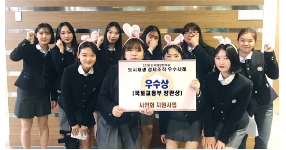
또래의 고민을 엿서와 전자우편으로 상담하는 '상담토끼'로 활동하는 조대여고 1~2학년 10명이 지난달 도시재생활마당 국토부장관상을 받고 기념촬영을 하고 있다.

상담토끼들은 홀로 때로는 동료와 함께 이들의 고민을 곱씹으며 답변을 써냈다. 가끔은 상대방의 입장을 풀어주려 또래가 쓸 법한 어투를 답장에 녹여내기도 했다. 편지를 보내는 아날로그 방식에 거부감을 느끼는 친구들을 위해 이들은 '카카오톡 오픈채팅방'을 열어 운영하고 있다. 우편함과 학교 곳곳에 붙은 포스터에 실린 QR