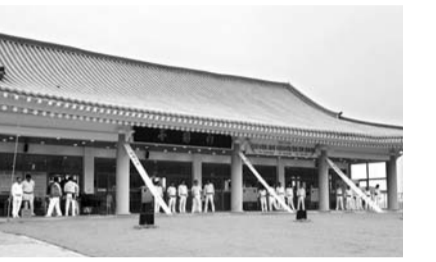
크가 있어 가족단위 관광객들이 내들이 하기가 좋다.

이외에도 국궁장 주변으로 홍길동 생가와 전신관, 4D영상관, 산채체험장, 풋살경기장, 야영장, 오토캠핑장, 정백한옥, 식당, 매점 등을 갖춘 홍길동테마파