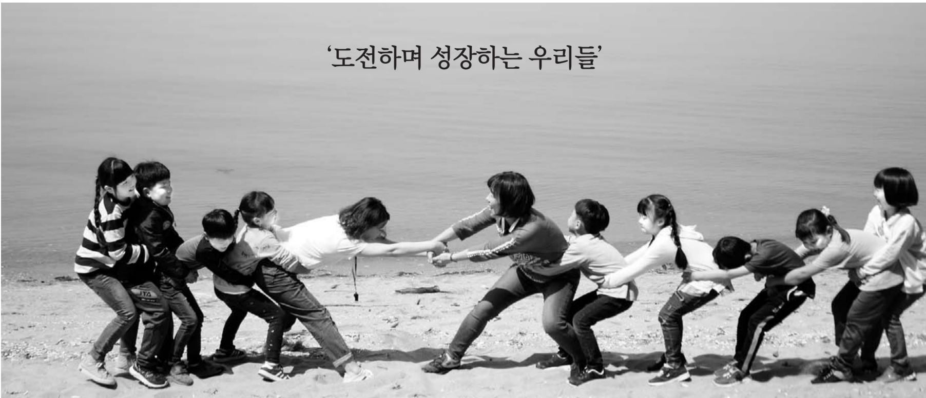
‘도전하며 성장하는 우리들’

햇살 좋은 어느 날 푸른 바다를 배경으로 교사와 어린이들이 두팀으로 나뉘어 손씨름을 하고 있다. 사진 속 주인공들은 고흥 두원초 교사와 학생들이다. 사진은 이 학교 정예주 교사가 전남도교육청(교육감 장석웅)이 주최한 ‘2018년 전남교육사진 공모전’에 ‘도전하며 성장하는 우리들’이라는 이름으로 출품한 것으로, 대상 수상작이다. 심사위원들은 ‘답답교사와 학생들이 승패와 상관없이 놀이를 즐기는 모습을 포착해 ‘모두가 소중한 혁신전남교육’을 잘 드러냈다’고 평가했다. 도교육청은 접수된 323점 가운데 당선작 37점을 선정, 3일 발표했다. 오는 17일부터 28일까지 교육청 1층 갤러리에서 당선작 전시회가 열린다. <전남도교육청 제공>