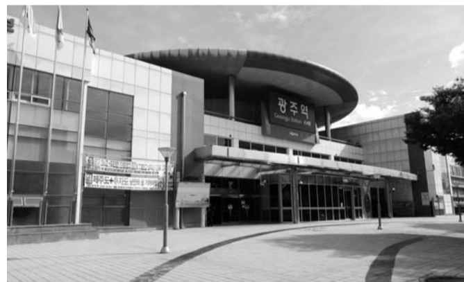
일제강점기인 1922년 광주와 담양을 잇는 전남선(광주선)의 개통과 함께 들어선 광주역은 2015년 4월 고속철도 정차역에서 배제되면서 쇠락의 길을 걷고 있다. 광주역 전경. 오른쪽은 대합실. 상하행 20편의 일반열차가 다니는 대합실은 열차시간이 되면 20여 명의 승객만 자리를 지키고 그 외 시간에는 텅 비어있다.