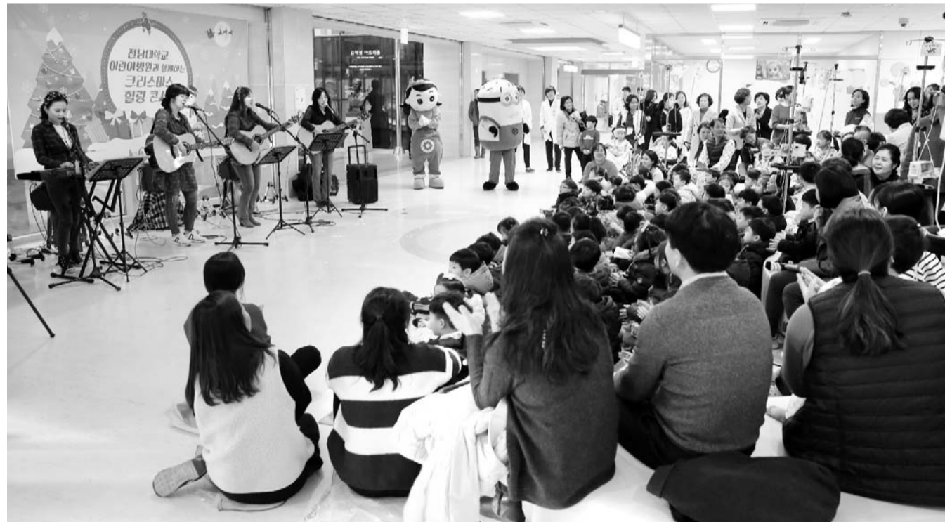
전남대어린이병원 '쾌유 기원 음악회' 하지 못하는 아쉬움을 달래주기 위해 마련됐다.