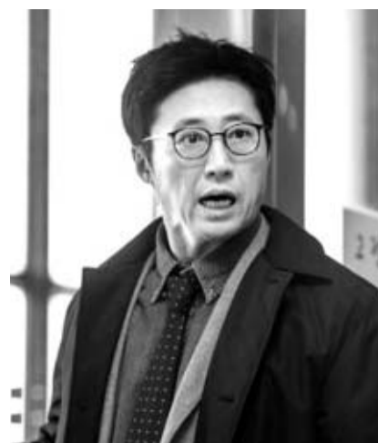
'동네변호사 조들호 : 죄와 벌'