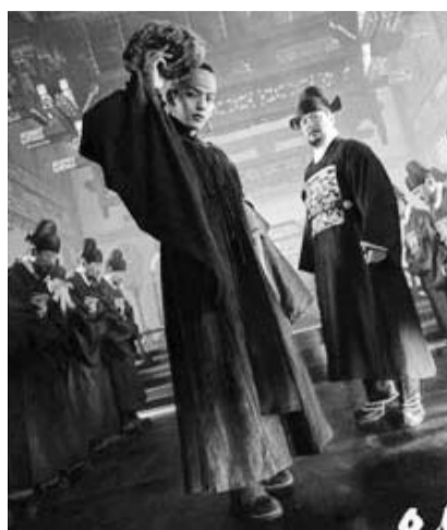
'왕이 된 남자'