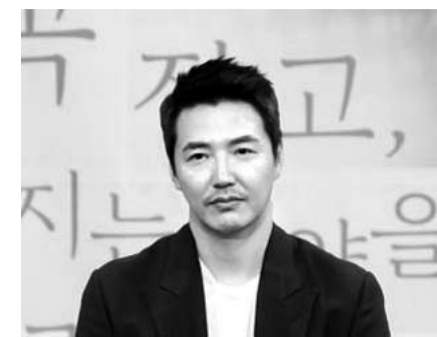
윤상현과 메이비는 지난 2015년 결혼해 두 딸을 뒀다.

윤상현은 소속사를 통해 "축하해주는 모든 분께 감사드리고 아내에게도 너무 고맙다. 앞으로 더욱 행복하게 잘 살겠다. 제 가족을 응원해주는 모든 분께도 다시 한번 진심으로 감사의 말씀 드립니다"고 소감을 전했다.