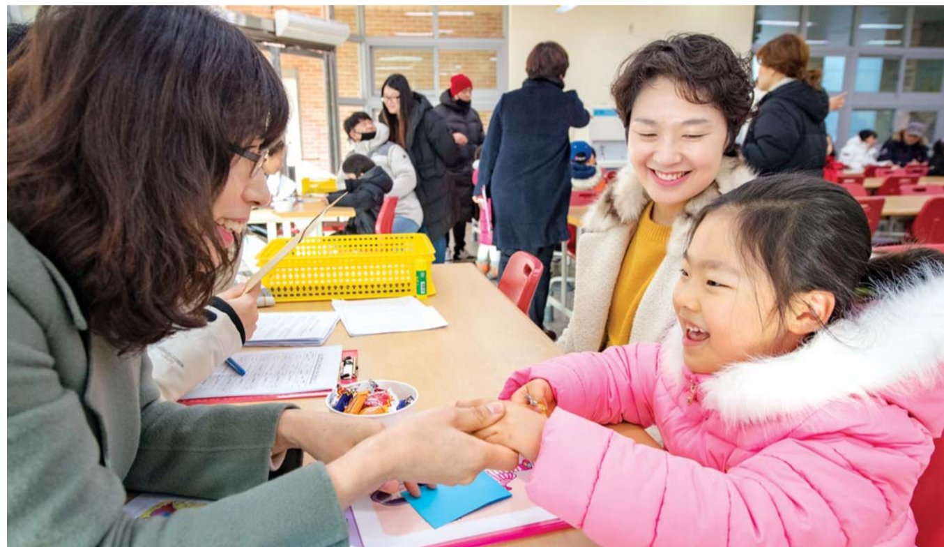
"학교생활 잘 할게요" 9일 광주시 동구 산수동 장원초등학교에서 열린 신입생 면담에서 예비 1학년 학생이 선생님과 학교생활에 대해 이야기를 나누고 있다.