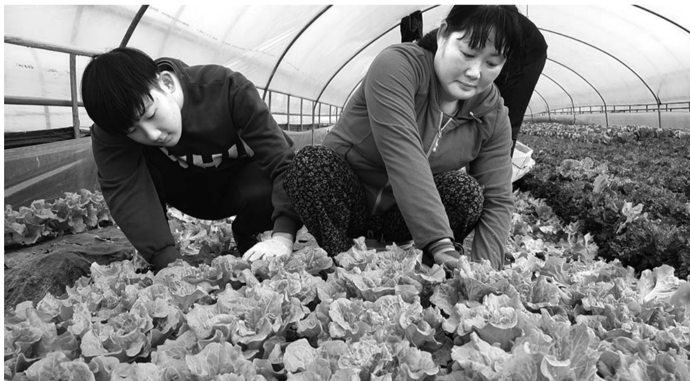
쌈 채소 수확 현장 남원시 금지면 귀석리의 한 비닐하우스에서 쌈 채소 수확이 한창이다. 남원에서는 겨울철에 금지면과 송동면 등지의 평야 지역을 중심으로, 여름철에는 운봉읍과 아영면 등 고랭지권에서 상추를 비롯한 10여 종류의 쌈채소를 생산한다.