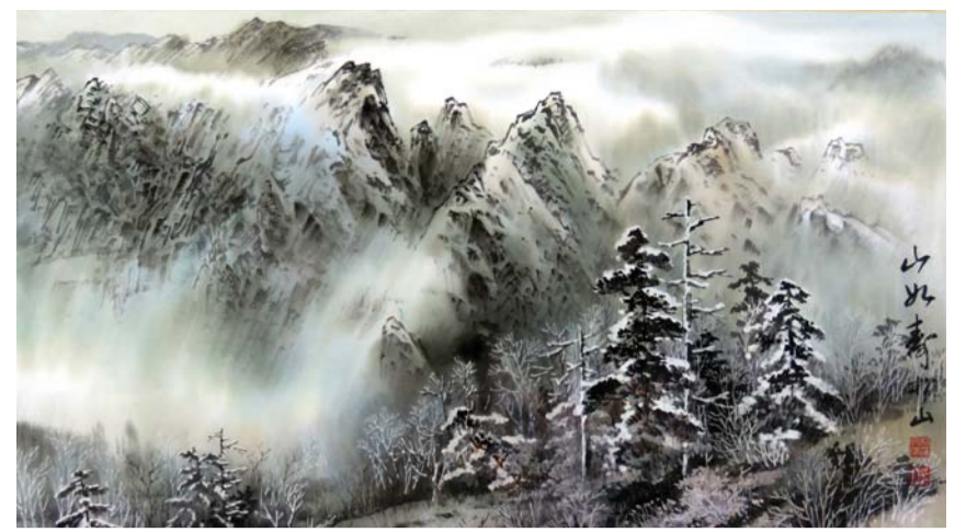
박문수 작 '설악 운해'