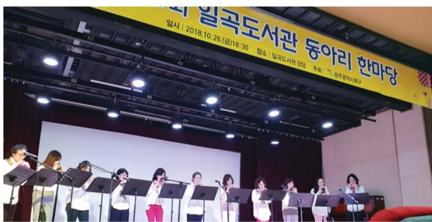
지난해 10월 열렸던 광주 일곡도서관 동아리 한마당 장면.

앞으로 공공도서관이 단순히 책을 빌리는 공간이 아닌 생활 밀착형 소모임과 체험의 장소로 거듭난다. 또한 오는 2023년까지 2017년 말 현재 1042개인 공공도서관 수를 1468개까지 확충하고 이용자 맞춤형 장소도 1인당 2.5곳까지 확대된다. 아울러 최신 기술을 도입한 모바일 디지털 서비스를 강화하는 등 미래지향형 도서관 기반시설도 구축될 예정이다.