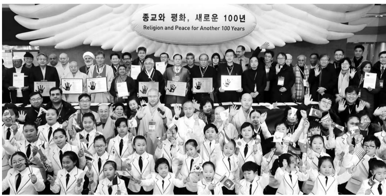
20일 경기도 파주시 경의선 도라산역에서 열린 3·1운동 100주년 기념 세계 종교인 평화기도회에서 국내 7대 종단 대표들과 세계 종교인 대표들이 어린이 합창단원들과 기념촬영하고 있다.

사망자가 발생한 시위는 모두 174건으로 집계됐으며, 사망자 수는 725~934명이었다. 일제는 3·1운동 사망자를 약 550명으로 추정했다.