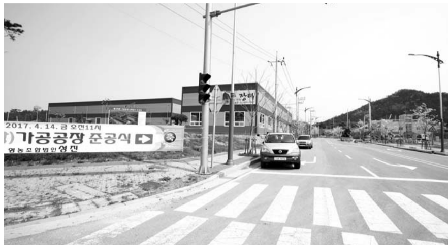
해남군 마산면 땅끝해남 식품특화단지가 최근 100% 분양을 완료했다.

이번 협약으로 잔여 2필지가 모두 분양됨에 따라 땅끝해남 식품특화단지는 21필지, 8만9427㎡가 모두 분양 완료됐다. 단지는 총 18개 기업이 분양된 가운데 땅끝하늘유통 등 6개 업체가 가동 중이며, 3개 업체 착공, 나머지 업체는 공사설계 및 사업계획 중이다. 군은 그동안 식품특화단지의 분양을 위해 기업인들과의 간담회, 박람회 참석 등을 통해 적극적인 유치활동을 펼쳤으며, 조성 4년만에 분양을 완료하는 성과를 거두었다. 해남군 관계자는 "100% 분양 완료한 만큼 해남만의 특색있는 식품특화단지로 육성하고, 제2 투자후보지를 발굴해 지역경제를 활성화에 나서겠다"고 밝혔다. 한편 땅끝해남 식품특화단지는 친환경 농수축산물을 원재료로 하는 식품품 제조업을 업종으로 하는 14만2570㎡ 규모의