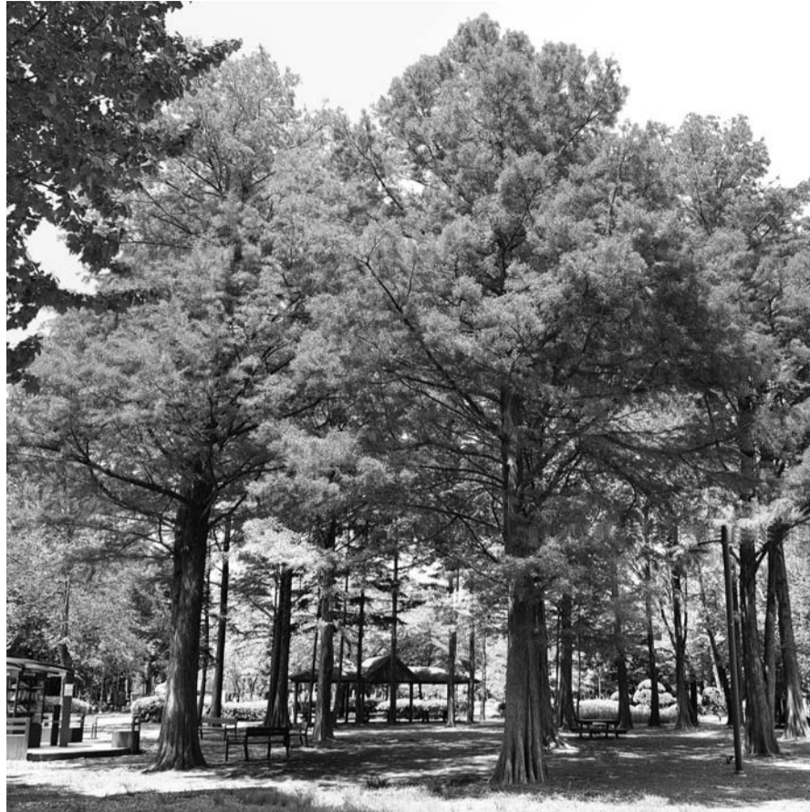
도시 숲은 나뭇잎이 미세먼지를 흡착·흡수하는 원리로 미세먼지 줄이기 효과가 우수함으로 나타났다.

연구는 위성영상자료를 통해 정규식생 분포지수를 산출해 7개 도시 각 구 도시 숲의 녹색 정도를 평가해, 도시 숲이 가장 적은 지역부터 가장 많은 지역까지 4분위로 나눴다. 또 각 개인의 성별, 교육수준, 직업, 소득수준, 혼인 여부, 건강 행태와 지역의 경제 수준 등 우울증에 영향을 줄 수 있는 다른 요소들의 효과를 보정했다. 이어 우울척도(CES-D) 문항으로 평가해 총점이 16점 이상인 경우 우울 증상이 있는 것으로 간주해 도시 숲과 우울 증상과의 관련성을 면밀하게 조사했다. 그 결과 도시 숲이 가장 적은 지역의 우울 증상 상대위험도를 1로 가정했을 때, 가장 많은 지역에 사는 사람의 평균적인 우울 증상 위험도는 0.813으로 평균 18.7% 낮게 나타났다. 이번 연구는 미세먼지와 폭염으로 인한 피해를 줄이는 도시 숲의 정신건강 증진 효과를 통계학적으로 분석한 결과다. /백희준 기자 bhj@연합뉴스