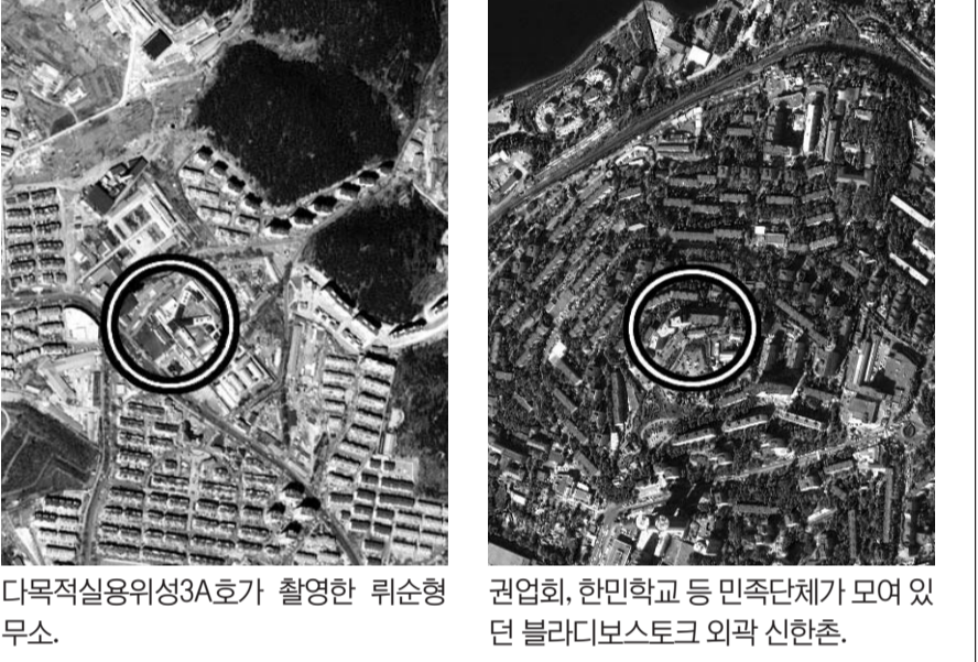
다목적실용위성3A호가 촬영한 뤼순형무소, 권업회, 한민학교 등 민족단체가 모여 있던 블라디보스토크 외곽 신한촌.