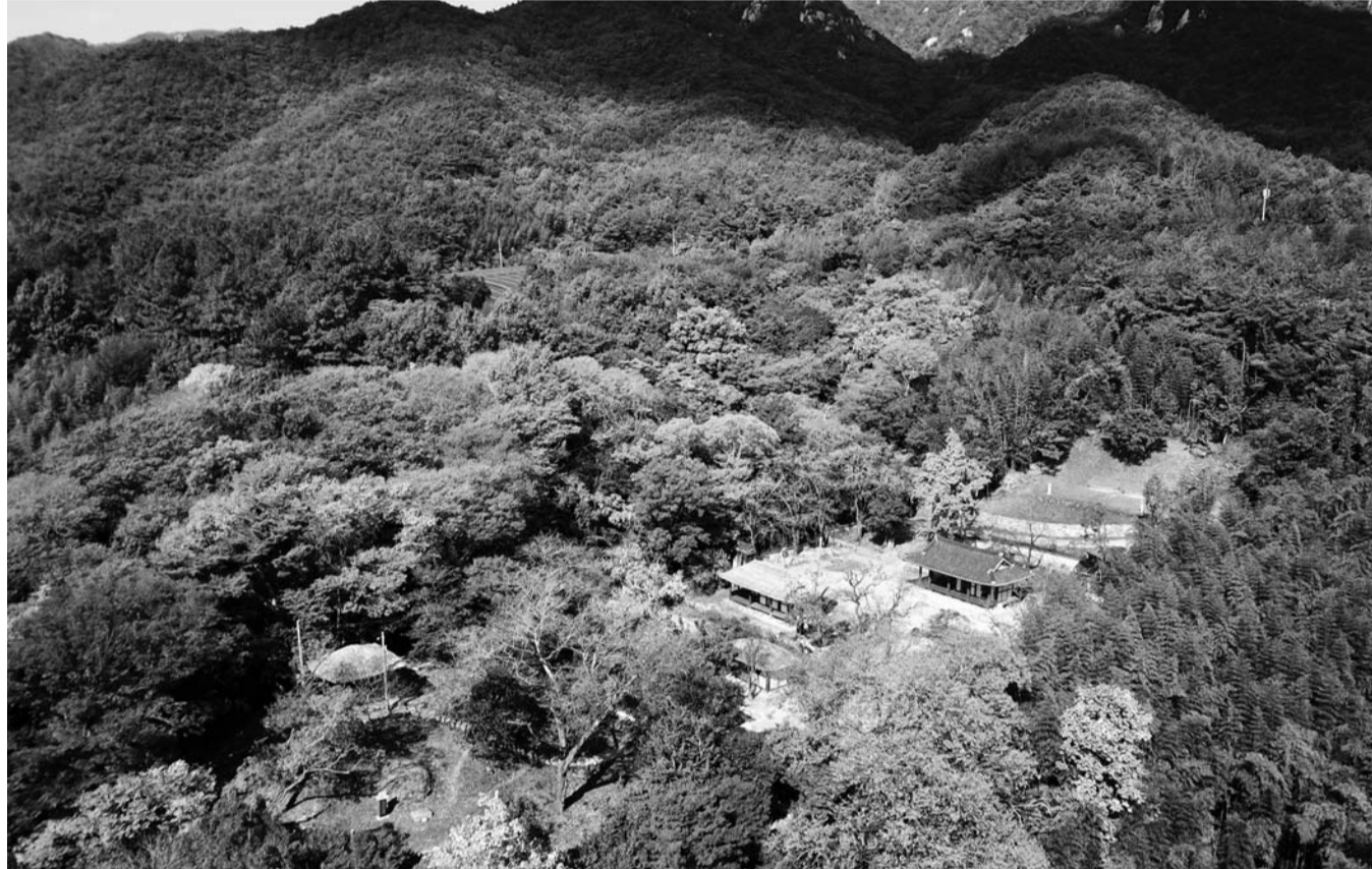
강진군 성전면 백운동 원림이 국가지정문화재 명승 제115호로 지정됐다. 옥판봉 정상에서 바라본 원림 전경.

다산과 초의선사가 남긴 작품은 '백운첩'에 전하며, 이시헌은 선대 문집·행록(行錄·언행을 기록한 글)·필목을 엮은 '백운세수첩'(白雲世手帖)을 만들었다.