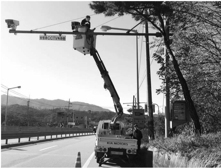
곡성군 관계자는 "학교 주변 범죄취약지역 CCTV 설치 사업, 카메라 성능 개선사업 등을 지속해서 실시해 주민의 안전한 생활 보장에 최선을 다할 계획이다"고 말했다. /곡성=김계중 기자 kjkim@

CCTV 확대설치와 통합관제센터 운영으로 범죄 예방 효과를 톡톡히 보고 있는 곡성군이 올해 CCTV 추가 설치에 나선다. <사진> 곡성군은 올해 상반기까지 CCTV 미설치지역 32개 마을에 56대의 CCTV를 추가 설치해 모든 마을에 CCTV망을 완성한다는 계획을 발표했다. 농촌 지역일수록 인적이 드문 곳이 많아, 각종 범죄 예방과 신속한 초동 대처에 CCTV가 큰 역할을 하고 있다. 곡성군은 범죄 사각지대를 없애 주민의 소중한 생명과 재산을 보호하기 위해 CCTV 확충에 나서 2016~2018년 228개 마을에 총 506대의 CCTV를 설치했다. 지난해 3월부터는 330㎡ 규모로 '곡성군 CCTV 통합관제센터'를 구축해 운영하고 있다. 곡성군 CCTV 통합관제센터는 지난해 ▲범죄 수사를 위한 정보 제공 73건 ▲차량