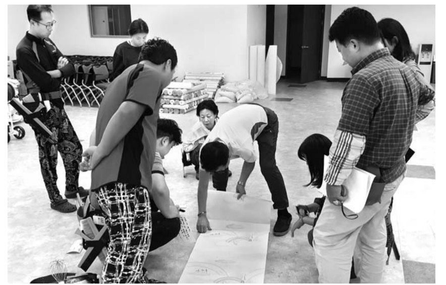
도배기능사 현장 실습.