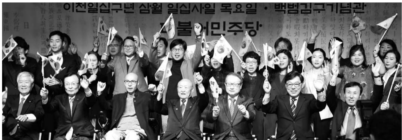
민주당 한반도 새 100년 위원회 출범 14일 서울 용산구 백범김구기념관에서 열린 더불어민주당 한반도 새 100년 위원회 출범식에서 이해찬 대표 등 참석자들이 만세시위를 하고 있다.

한편, 지난 2018년 9월부터 10월까지 열린 국제수목비엔날레는 2개월 동안 29만여 명의 관람객이 몰리는 등 예상 전남의 문화역량을 유감없이 발휘해 수목의 예술성과 대중성까지 확보했다는 호평을 받았다. /최권일 기자 cki@kwangju.co.kr