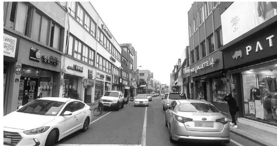
강진군 중앙로상가가 '2019년 희망사업 프로젝트 육성사업'에 선정돼 시장활성화 사업을 펼친다. 강진군 중앙로상가 일대.