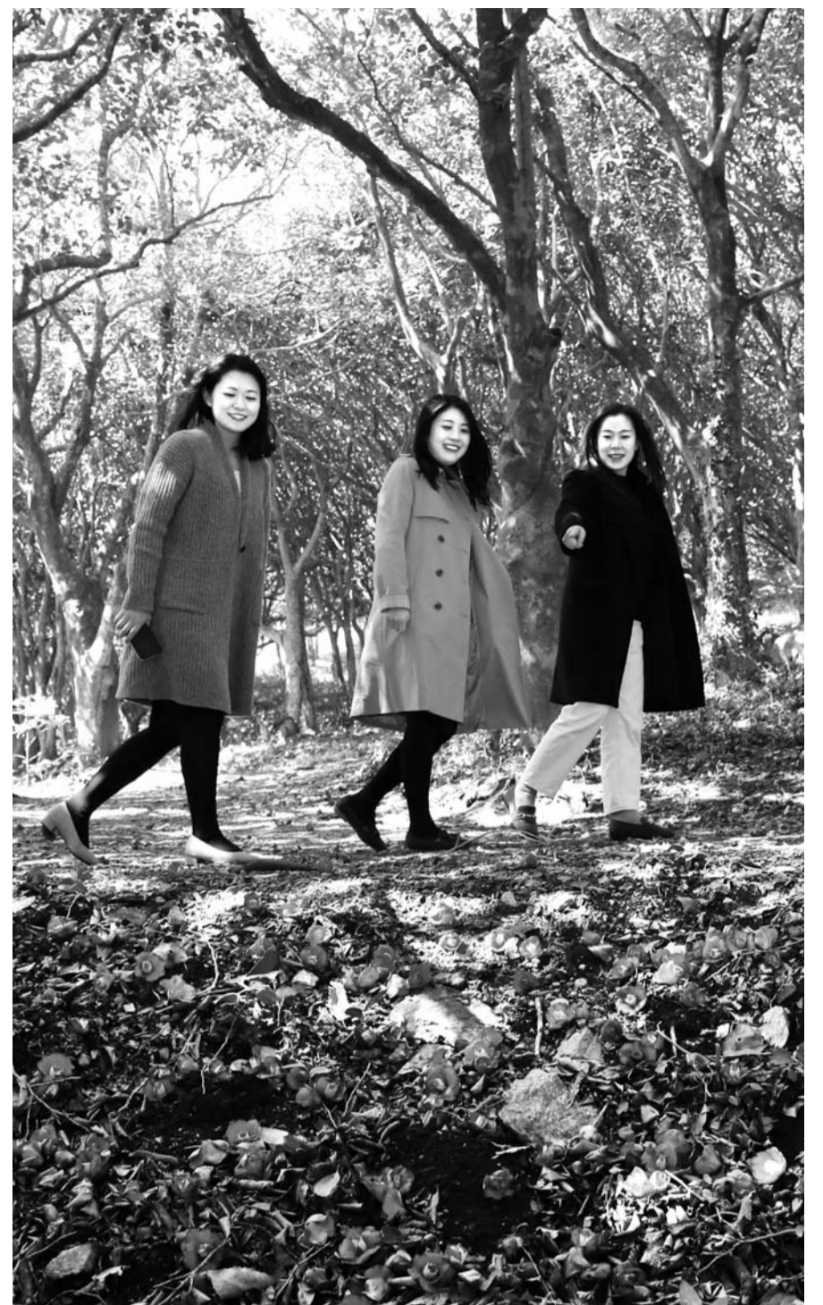
동백의 女心 유혹 봄 기운이 이어진 지난 17일 강진군 도암면 만덕산 자락의 천년고찰 백련사 동백림(천연기념물 제151호)이 붉은 동백꽃으로 장관을 이룬 가운데 낙화를 시작한 동백꽃이 마치 양탄자를 깔아 놓은 듯 아름다움 모습을 연출하고 있다.