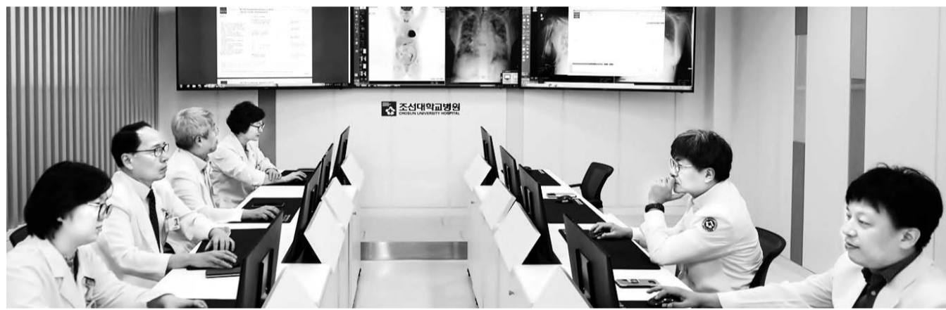
암 다학제 통합 진료팀의 회의 모습

각 분야의 전문의로 구성 10개 '다학제 통합 진료팀' 신속하고 정확한 암 진료