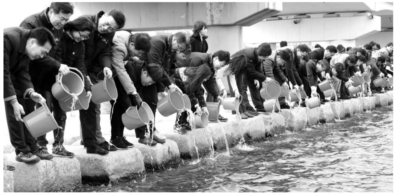
지난 22일 탐진강 장흥교 아래에서 지역 초등학생과 어촌계원, 수산업경영인회, 군 해양구조대 등 100여명이 참여한 가운데 은어 방류행사가 열렸다.

강진군이 최근 성전면 지역주민들 100여명을 대상으로 성전면사무소에서 일자리 창출을 위한 강진산단 맞춤형 직원 채용설명회를 개최했다. (사진) 강진군은 앞서 강진산단의 인근 마을인 당산마을, 송학마을 주민 50여명을 대상으로 두 차례에 걸쳐 강진산단 직원 채용설명회를 진행했다. 이번 강진산단 맞춤형 직원채용 설명회는 이승욱 강진군수가 직접 지역주민들의 건의사항을 반영해 마련한 자리로 성전면 지역주민을 대상으로 기업소개, 채용계획 및 채용 일정, 공사진척 상황 등을 설명하고 취업에 필요한 개별 취업 상담도 이뤄진다. 군은 일자리 창출 활성화를 위해 강진산단 취업과 관련해 숙련된 인력이 필요할 경우 군비 지원을 통해 교육과정을 제공하는 것을 비롯 인성과 적성, 위탁교육, 기능교육 등 다양한 교육지원 프로그램을 통해 인재 양성 및 취업을 향상에 박차를 가한다는 방침이다. 현재 강진산단 내에는 32개 기업이 분양계약을 완료했다. 4개 기업이 가동 중에 있으며 7개 기업이 공사 중에 있다. /강진=남철희 기자 choul@