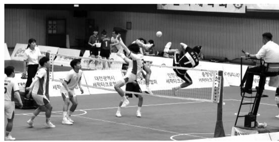
지난해 영암에서 개최된 전국 세팍타크로 대회 모습.

는 남·여 일반부, 대학부, 고등부, 중등부로 나뉘어 더블이벤트(2인조), 레규이벤트(3인조), 쿼드이벤트(4인조) 3개 부문에서 73개팀 500여명이 참가해 열띤 경쟁을 펼친다. 영암군 관계자는 "이번 대회로 7일간 500여 명이 우리 군에 체류하면서 숙박, 음식점, 지역 마트 이용 등 지역경제 활성화에 기여할 것으로 기대된다"고 말했다. /영암=전봉헌 기자 jbh@