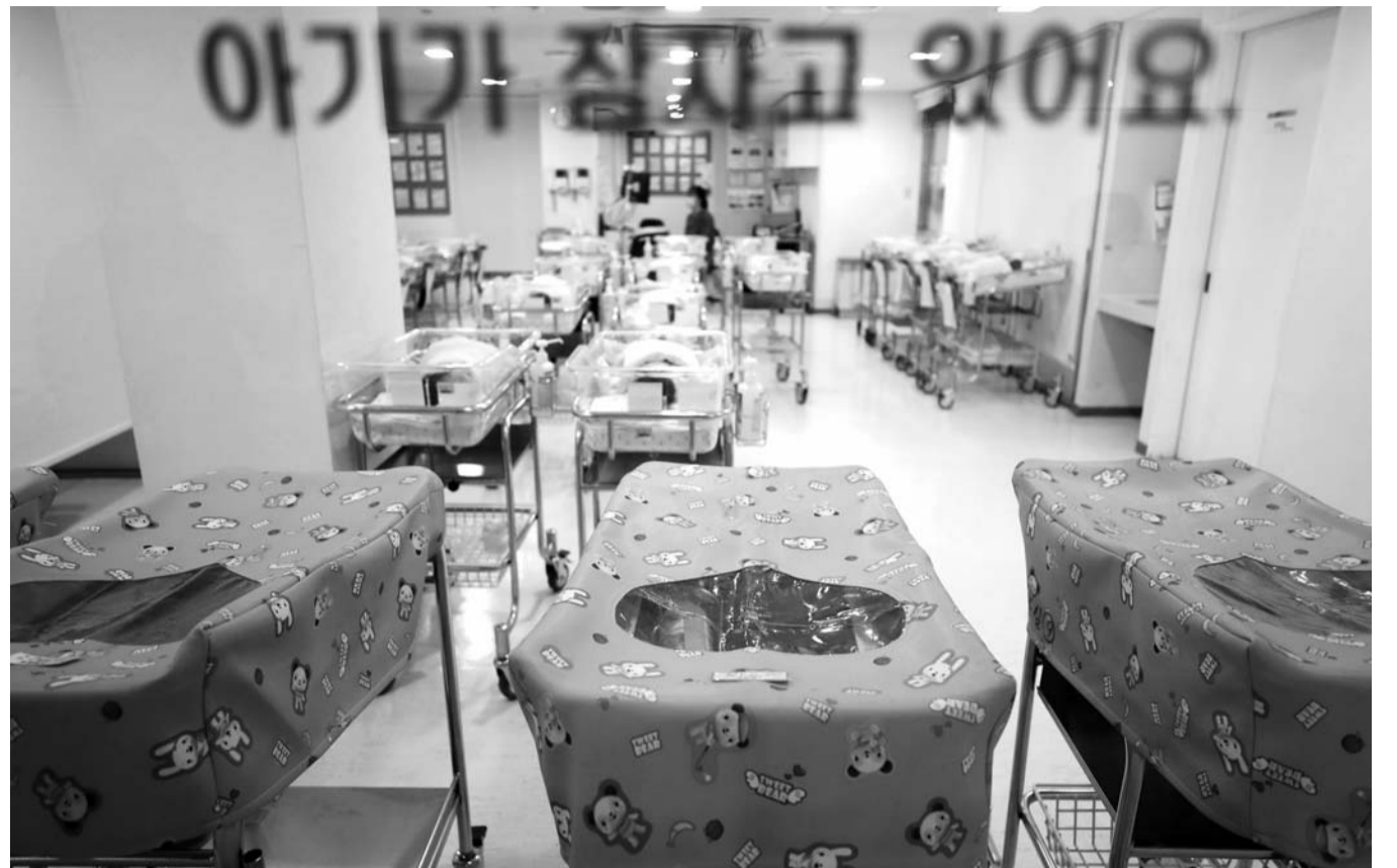
한국 인구가 최악의 경우 내년부터 줄어들기 시작해 2067년에는 3300만명대에 그칠 것이라는 암울한 전망이 나왔다. 28일 통계청이 발표한 장래인구특별추계의 저위 추계 시나리오에 따르면 올해(2019년 7월~2020년 6월) 총인구가 5165만명으로 정점에 도달했다가 2020년부터 0.02%(1만명) 감소하는 것으로 나타났다.