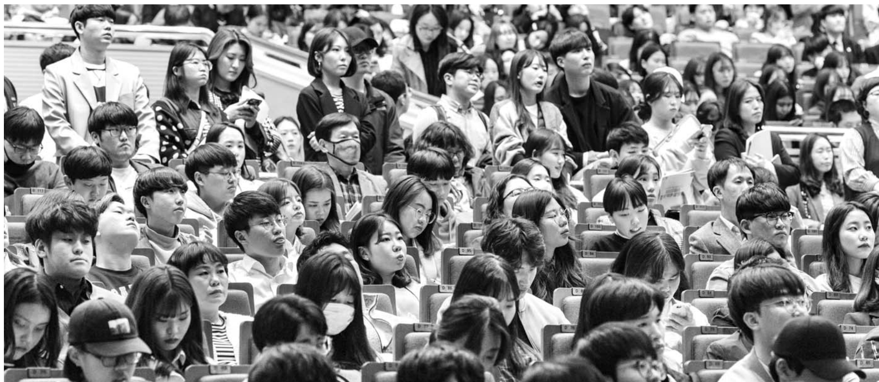
혁신도시 공공기관 채용설명회 4일 오후 광주시 동구 서석동 조선대학교 해오름관에서 열린 광주·전남혁신도시 공공기관 합동채용설명회를 찾은 대학생들이 강연내용을 주의깊게 바라보고 있다.

해수부는 수산업에 종사하는 청·장년층 발굴을 위해 이 사업을 시작했으며, 올해까지 3만여명이 수산업경영인으로 선정됐다. /연합뉴스