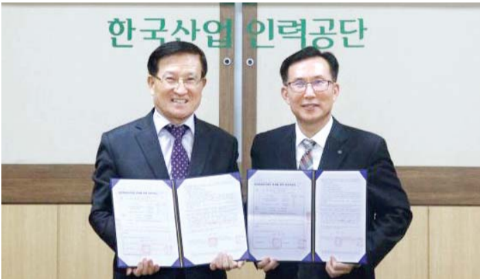
남부대학교 산학협력단(단장 김동복)은 최근 한국산업인력공단 광주 지역본부(본부장 김대수)와 청년취업아카데미 운영기관 약정을 체결했다.