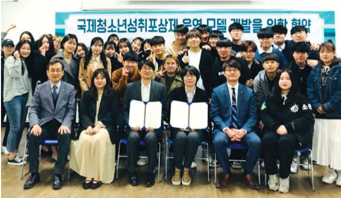
광주대학교(총장 김혁중) 청소년상담평생교육학과가 최근 국제청소년취포상제 운영을 위한 관계기관 업무협약을 체결했다.