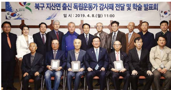
광주시 북구(청장 문인)는 8일 북구청 2층 상강실에서 독립운동가 문중과 후손, 정책자문단, 전남대학교 교수 등이 참석한 가운데 3·1운동과 임시정부수립 100주년을 기념하기 위해 북구 지산면 출신 독립운동가 감사패 전달과 학술발표회를 개최했다.