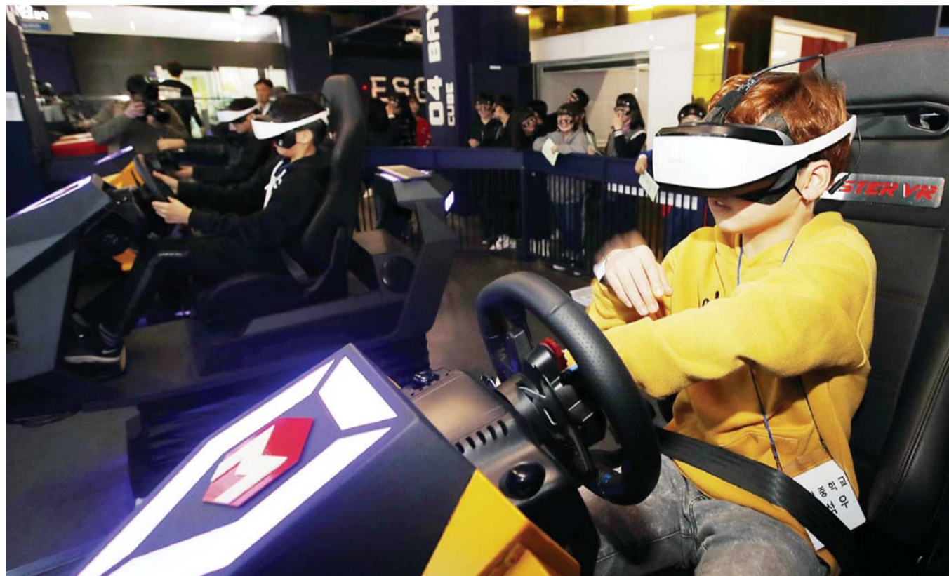
광주역 AR/VR센터 가상현실 레이싱 게임 11일 광주시 북구 광주역 내 광주AR/VR제작거점센터에서 열린 광주시 북구 주민참여형 '따나요! 과학소풍' 과학프로그램에 참여한 지산중학교 학생들이 가상현실 레이싱 게임을 즐기고 있다.