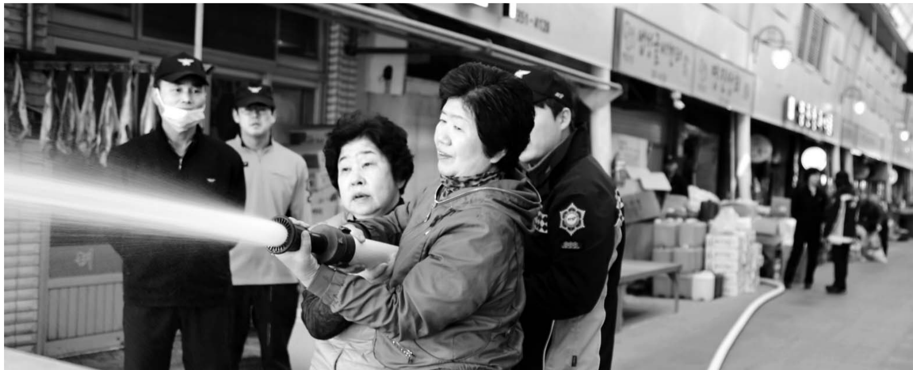
화재 초기진압은 이렇게... 최근 영광소방서 주관으로 열린 소방교육에서 영광 매일시장 상인들이 비상소화전함을 이용한 화재 초기 진압법을 실습하고 있다.