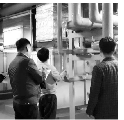
고, 이용주민들이 공중위생업소를 안전하게 이용할 수 있도록 시설물 안전관리에 만전을 기하겠다"고 말했다. /영암=전봉헌 기자 jbh@

영암군은 최근 지역내 숙박·목욕업소 등 공중위생업소에 대한 국가안전대진단 민·관 합동 점검을 진행했다. <사진> 담당 공무원과 건축·소방·전기분야 민간 전문가로 구성된 민관합동점검반 5명이 숙박업소 15곳과 연면적 1000㎡ 이상 대형목욕업소 3곳 등 모두 18개 업소 시설물의 구조 이상 여부와 시설관리 상태, 안전설비 작동여부 등을 확인했다. 점검결과 현지 시정 사항은 즉시 시정 조치하고 안전위험 요인이 있는 업소에 대해서는 빠른 시일 내에 보완 조치했고, 보수가 완료 될 때까지 지속적으로 확인 점검을 해 나갈 계획이다. 영암군 관계자는 "앞으로도 재해로 인한 인명 및 재산 피해를 사전에 예방하