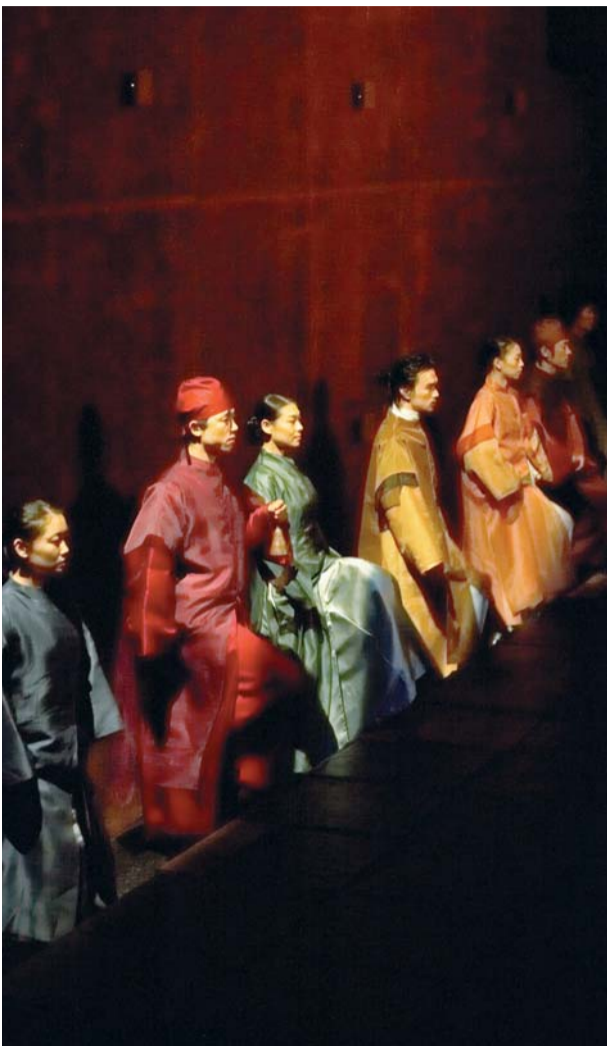
6월 광산문화예회관에서 공연되는 뮤지컬 '왕세자 실종사건'.