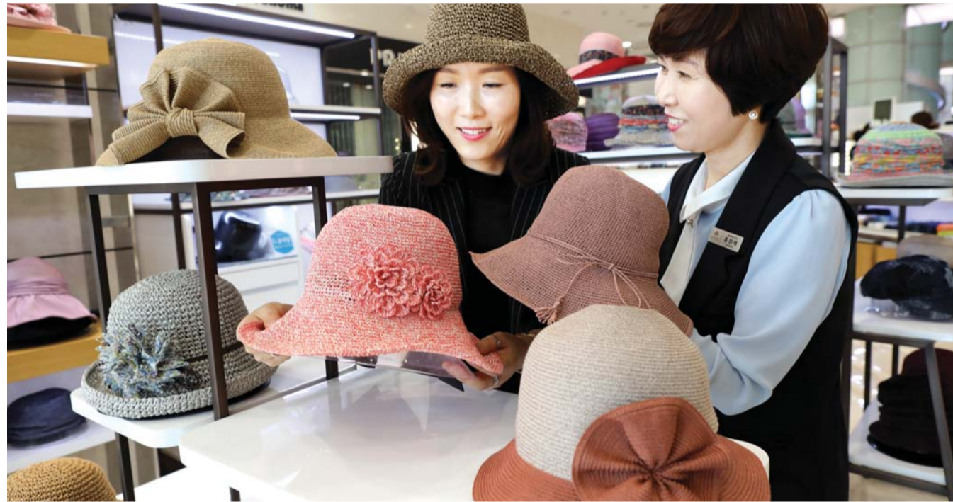
가볍고 시원한 '라피아 모자' 롯데백화점 광주점 1층 모자 매장에서 고객이 라피아 소재의 모자 상품을 착용해보고 있다. 야자나무나 열대나무의 라피아의 잎을 말려 가공한 천연소재인 라피아는 가볍고 시원해 봄·여름철 인기가 높다.