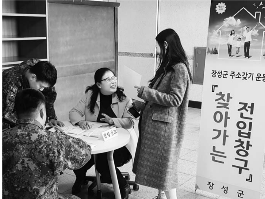
장성군 관계자들이 상무대에서 '찾아가는 전입신고 창구'를 운영해 성과를 내고 있다.

과제를 새롭게 발굴하고 더 강력해진 연어프로젝트 추진에 나선다. 이를 위해 '새로운 인구유입 흐름형성', '청년자립-결혼-육아 지원', '세대·지역 맞춤형 일자리 지속 창출', '정주여건 조성·지역공동체 활력화' 등에 집중한다. 추진과제 중 하나인 '찾아가는 전입신고 창구' 운영은 이미 시작과 동시에 성과를 거두고 있다. 주 타깃은 기존에 전입신고를 받지 않았던 상무대 영내에 거주하는 직업군인 가족들이었다. 장성군은 전입신고 독려를 위해 관련 법령 검토, 행정안전부 질의 등 꼼꼼한 사전 절차를 거쳐 상무대 장기교육생을 대상으로 찾아가는 전입신고 창구를 매월 5차례씩 운영한 결과 116명의 새로운 장성군민을 만드는 성과를 거뒀다. 지난해 10월부터는 '장성군 인구 늘리기 지원 조례' 제정을 통해 전입 장려금, 결혼 축하금, 국적취득 축하금, 유공기관 장려