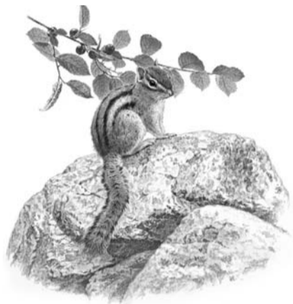
광주시립미술관 전시서 만나는 이태수작 다림질.