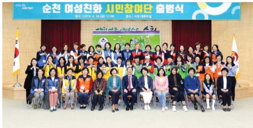
'여성과 시민 모두 행복한 여성친화도시' 조성을 위한 순천 여성친화 시민참여단이 지난 26일 출범식을 갖고 본격적인 활동에 들어갔다.

성'과 '지역사회 활동 역량강화', '경제·사회 참여 확대', '지역사회 안전증진', '성 평등정책 추진기반 구축' 등 5개 분야로 나뉘어 활동한다. 순천시 3대 범 시민운동 참여와 지역의 불변하고 불합리한 사항을 모니터링해 개선 의견을 제안하는 등 여성 친화적 지역 문화 확산을 위해 일하게 된다. 시민참여단은 여성 친화적 지역 문화 확산을 위한 공감대 형성과 홍보활동에도 참여할 계획이다. 시는 또 '순천 여성친화 시민학교'를 운영해 참여단의 역량을 강화하고 여성친화도시 조성 관련 사회 참여 기회를 제공한다. 이와 관련 시는 여성친화도시 조성을 위해 ▲활기찬 순천 ▲안전한 순천 ▲가족친