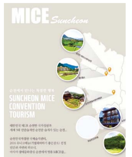
순천시 마이스산업 홍보 포스터.

순천시의 마이스(MICE)산업 유치를 위한 노력이 성과를 내고 있는 것으로 나타났다. 마이스 산업은 회의(Meeting)와 포상관광(Incentive trip), 컨벤션(Convention), 전시박람회와 이벤트(Exhibition) 등을 유치해 지역경제에 활력을 불어넣는 새로운 부가가치산업으로 인식되고 있다. 시는 '2019 순천방문의 해'를 맞아 마이스 산업 유치 지원금을 확대하고 가이드북, 홍보 컬러링 북 등을 제작해 전국에 배부했다. 또 4월 초에는 수원 컨벤션센터에서 열린 '2019 아태마이스비즈니스페스티벌'에 참가해 순천의 마이스 시설 등을 적극 홍보했다. 그 결과 지난 26일부터 이틀간 열린 '한국 경찰학회 제38회 학술대회'가 첫 지원을 받았다. 200여명이 참석한 한국경찰학회는 1998년 10월에 설립된 단체다. 이와 함께 지난 26일과 27일 순천대학교 국제문화컨벤션관에서는 110여명이 참석한 '한국환경경제학회의 2019 춘계