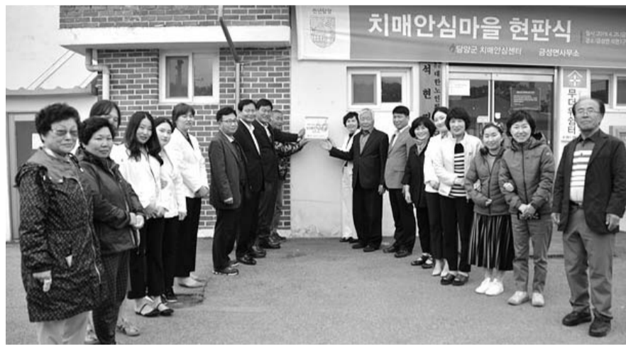
인지강화교실이 운영되며 치매어르신들에게는 치매안심 돌봄서비스와 쉽터 운영 프로그램이 제공된다. 또 치매대상자들의 배회 및 실종예방을 위한 치매안심마을을 구축하고 마을 홍보관을 운영하는 등 다양한 치매 친화적인 환경을 조성할 예정이다. /담양=서영준 기자 xyj@

담양 첫 치매안심마을로 지정된 석현리가 치매안심마을 현판식을 갖고 본격적인 사업에 착수했다. 담양군 치매안심센터는 최근 금성면 석현리 마을회관에서 치매안심공동체 운영위원회와 마을주민 등 70여명이 참석한 가운데 현판식을 개최했다고 밝혔다. <사진> 현판식에서는 참석자들에게 치매예방 수칙에 따른 홍보책자를 제공했으며 치매 예방 체조 등 다양한 운동 프로그램도 함께 진행했다. 치매안심마을로 지정된 석현리는 앞으로 만 60세 이상 주민에게 치매선별 전수 조사와 경로당 치매예방교실, 가족교실,