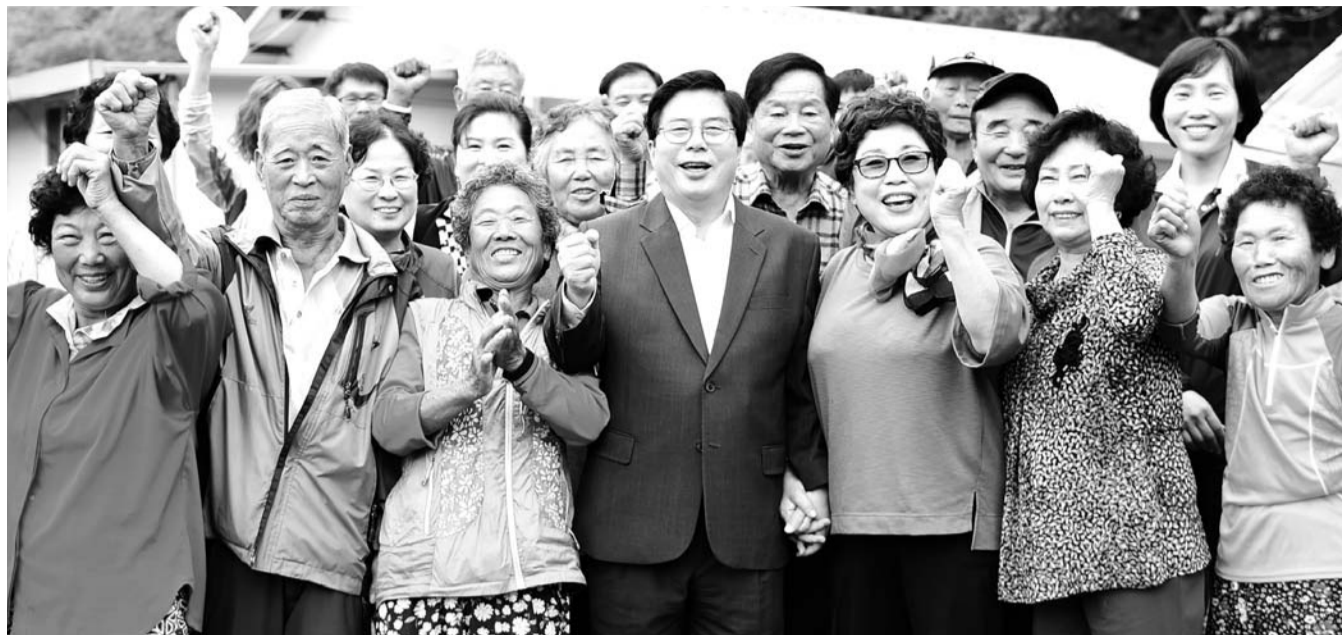
유두석(가운데) 장성군수가 최근 삼계면 내계리마을을 찾아 지역 어르신들과 기념 촬영을 하고 있다. (장성군 제공)

‘목욕 + 이·미용 쿠폰’ 지급 효도권 사업 예산 3배 증액 내달까지 읍면동 경로당에 안마의자·공기청정기 보급