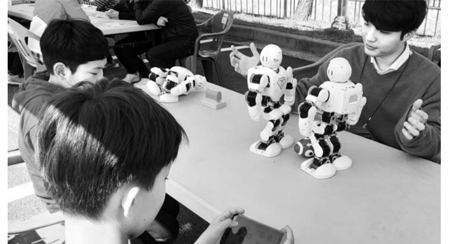
조선대학교 SW융합교육원은 최근 고흥군 나로우주센터에서 진행된 '제12회 고흥 우주항공축제'에서 체험 부스를 열고 광주·전남 지역 초·중·고교 학생들에게 등 다양한 SW교육용 로봇과 체험 프로그램을 선보였다.