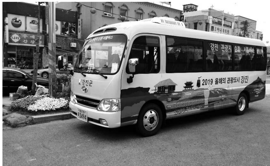
강진 지역을 권역별로 순회하는 관광지 순환셔틀버스가 운영을 시작했다. 강진군문화재단이 운영중인 순환셔틀버스.

강진 권역별 관광지 순환셔틀버스를 각 권역별 1시간 배차간격으로 운행하고, 1일