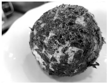
나눔의 광주정신 담은 주먹밥

대학생 3명 부산서 5·18 알리기 김밥전문점 주먹밥 수익금 기부 자산동 주민·동산초 영화 상영 고양 호남향우회 강연회 열고 양동시장 주먹밥 나눔 행사도