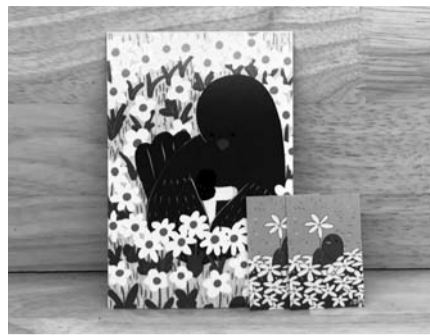
대학생이 만든 5·18 기념엽서

5·18민주화운동 39주년을 맞아 광주시민들 사이에서 소소한 삶 속에 오월 정신을 녹여내고 실천하는 바람이 불고 있다. 시민들은 직접 만든 5·18기념엽서를 다른 지역에서 나눠주거나 주먹밥을 판매하고 남은 수익금을 기부하는 이벤트 등을 자체 기획해 눈길을 끌고 있다. 박세연(26·조선대 정치외교학과)씨와 박화경(여·25·조선대 만화애니메이션학과)씨 등 지역 대학생 3명은 오는 18일 부산에서 5·18 알리기 캠페인을 진행한다. 이들은 16일 "지난 3월 광주시 청년드림 사업을 계기로 인연이 된 셋이 뜻을 모아 5·18 캠페인을 함께 만들어보기로 했다"며