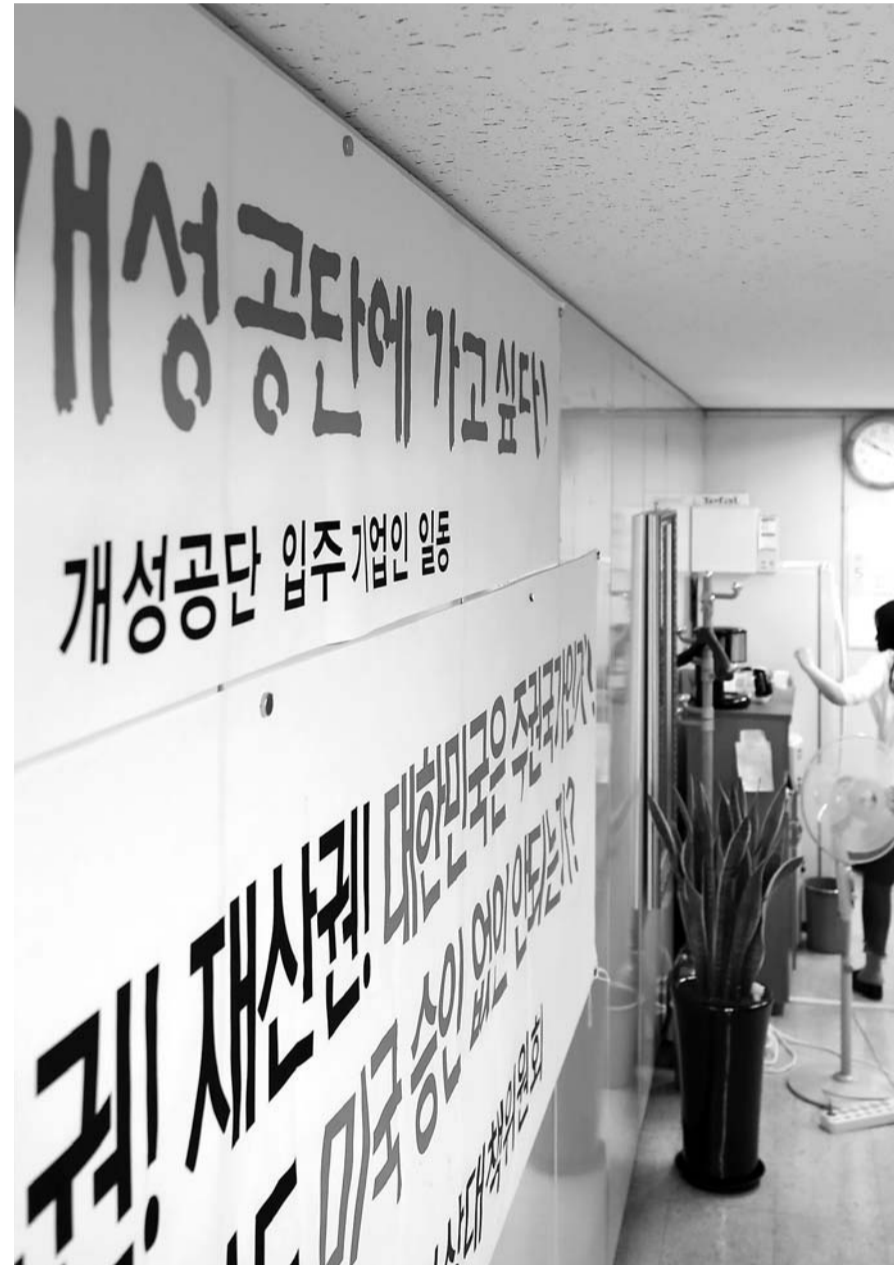
“개성공단 점검을 위한 방북을 염원합니다” 20일 서울 영등포구 개성공단기업협회에 개성공단 점검을 위해 방북을 염원하는 현수막이 부착돼 있다. 앞서 17일 정부는 개성공단 입주기업인들의 방북을 승인한 바 있다.

등도 반영했다. 상생 분야는 혁신도시 공동발전기금 조성하고 혁신도시 규제 허파 빛가람 규제 샌드박스 도입, 신규 공공기관 유관기관 및 연수원 유치, 이전기관 연계형 원도심 마을 특화사업 추진 등이다. 정주 여건 분야에서는 광주 효천역과 나주역을 잇는 광역철도를 놓고 어린이 청소년 테마도서관 건립, 수요자 중심 혁신도시 교육환경개선 등은 정주여건 분야다. 스마트시티 분야에서는 단독주택형 태양광 보급 사업을 확대하고 에너지 온실가스 통합관리 시스템과 빅데이터 서비스 플랫폼을 갖춘다. 지능형 광역환경 모니터링 시스템과 독거노인 건강관리 및 토탈 케어 서비스, 장애인 최적 안전 경로 확보체제도 구축한다. 지역인재 분야에서는 한전 공과대학 설립을 통한 국가 성장동력 확보, 산학협력 맞춤형 인재 육성, 산학연 융합 오픈 캠퍼스 확대 운영 사업 등을 추진한다. 연구원은 이 같은 혁신도시 시즌2 목표 달성에 필요한 실행력 제고 방안을 모색하고 관리체제와 주체, 통합컨트롤 타워 구축 필요성을 강조했다. 주민특성에 부합하는 정주 여건 시설 개선과제를 우선순위로 발굴하고 여성과 가족의 관점에서 기초해 지역사회 현안의 미스매치를 해소하는 한편 새로운 아이디어 중심으로 해결방안을 모색해야 한다고 제안했다. /김지우 기자 dok2000@kwangju.co.kr