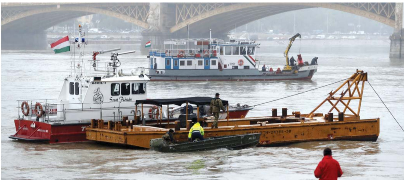
한국인 관광객들을 태운 유람선 '허블레이니호'가 헝가리 부다페스트 다뉴브강에서 다른 유람선과 충돌해 침몰한 다음날인 30일(현지시간) 선박들이 현장에서 구조활동을 펼치고 있다.

이들은 국내 여행사 '참좋은여행' 패키지 여행을 하던 한국 관광객으로 확인됐다. 여행사 측은 한국인은 자사 인솔자를 포함해 모두 33명이 탑승했다고 밝혔다. 외교부에 따르면 한국인 탑승자는 관광객 30명과 인솔자 1명, 가이드 2명이다.