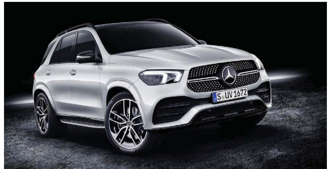
메르세데스-벤츠 '더 뉴 GLE'

2'의 출시를 앞두고 있다. 지난해 단종한 카렌스 공장에서 생산할 계획이다. 기아차는 SP2를 통해 최근 몇년간 급성장한 소형 SUV 시장을 공략한다는 방침이다. 또 기아차는 '모하비' 부분변경 모델을 통해 대형 SUV 시장 장악에도 나선다. 제네시스도 브랜드 최초의 SUV 모델인 'GV80'을 올해 4분기 중에 내놓을 예정이다. 한국GM은 최근 국내에서 빠르게 성장하고 있는 대형 SUV 시장 진입을 위해 하반기 '트레비스'의 판매를 시작한다. 지난해 하반기 출시한 중형 SUV 이쿼닉스와 중·대형으로 이어지는 SUV 라인업으로 판매 강화에 나선다는 전략이다.