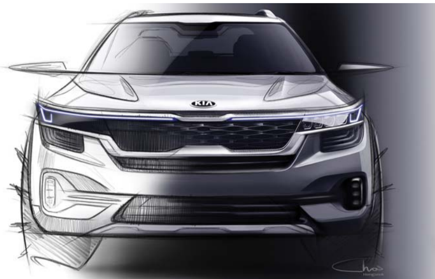
기아차 하이클래스 소형SUV 렌더링 이미지 공개

◇기아차 광주공장 소형 SUV 등 출시 현대·기아차는 올 하반기에 SUV에서만 4종의 신차 출시를 계획하고 있다. 상반기 팔리세이드로 대형 SUV 시장에 성공적으로 안착한 현대차는 오는 7월 SUV '베뉴'를 선보인다. 지난 4월 뉴욕모터쇼에서 세계 최초로 공개된 베뉴는 현대차가 선보이는 첫 초소형 SUV 세그먼트 모델이다. 베뉴 출시를 통해 현대차는 '베뉴-코나(소형)-투싼(준중형)-싼타페(중형)-팔리세이드(대형)'의 SUV 풀라인업을 갖추게 된다. 기아차는 광주공장에서 생산하는 소형 SUV 'SP