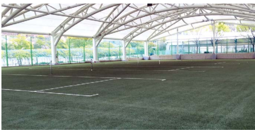
편을 감수한 시민께 감사 드린다”며 “앞으로 도로 생활체육 활성화를 위해 시설물 관리

와 각종 대회 유치에 힘쓰겠다”고 말했다. /여수=김창화 기자 chkim@kwangju.co.kr