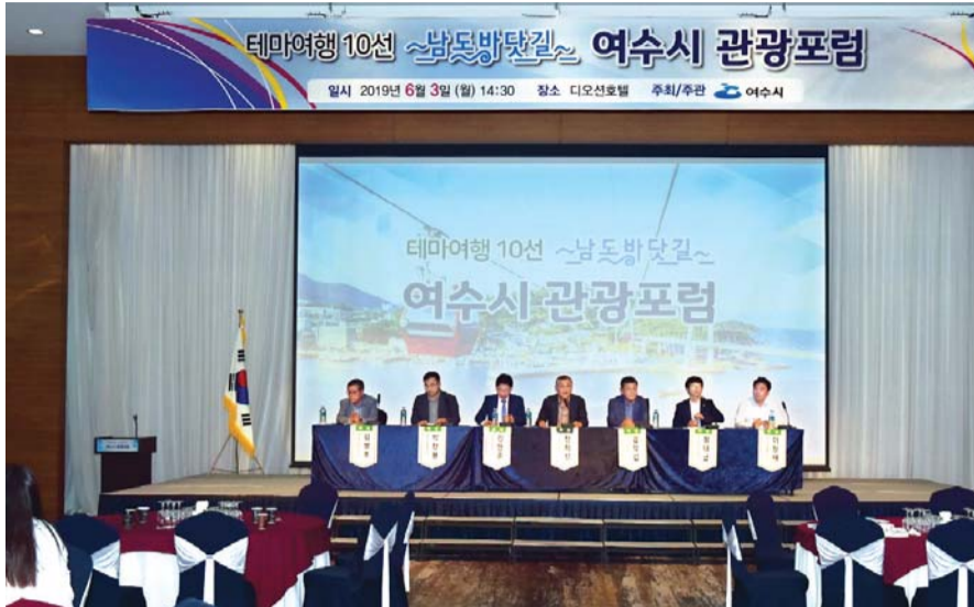
지난 3일 여수 디오션호텔에서 열린 '2019 테마10선 6권역 포럼-여수시 지역 관광포럼'에서 참가자들이 '섬, 산림자원을 활용한 웰니스 관광 활성화 방안'을 주제로 토론을 펼쳤다.

“대한민국 테마여행 10선”은 문화체육관광부와 한국관광공사가 권역별 광역 관광을 활성화하기 위해 전국 10개 권역을 ‘테마여행 10선’으로 선정, 2017년부터