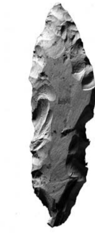
신복 유적형 찌르개