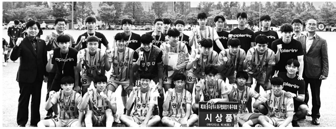
광주대 축구부가 최근 광주과학기술원 축구장에서 열린 제3회 광주시축구협회장기 대학부 결승전에서 동강대를 2-0으로 이기고 우승을 확정짓고 기념촬영을 하고 있다.