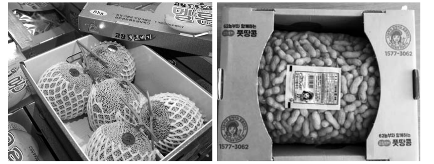
고창군 지역 특산품인 황토 멜론(왼쪽)과 풋망고.

바탕으로 국내 시장과 해외 시장을 아우르는 기업으로 발돋움할 수 있도록 지원을 아끼지 않겠다”고 말했다. /정읍=박기섭 기자·전북취재본부장