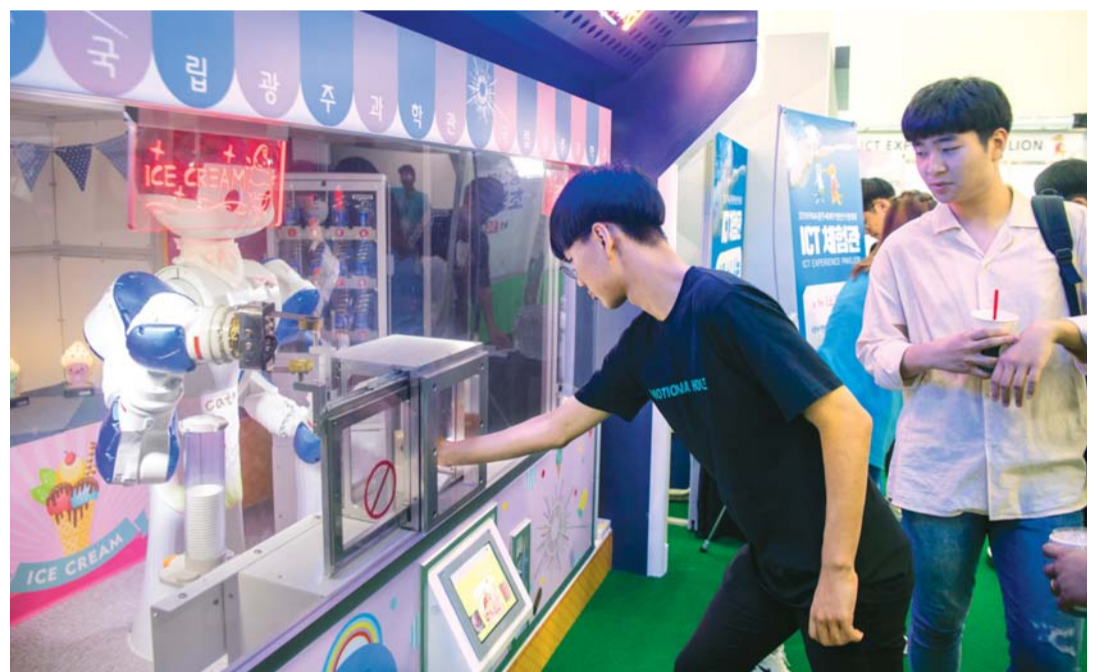
관람객이 로봇 웨이터에게 아이스크림을 주문하고 있다.

공을 날 수 있는 공간이 마련되어 있다. '홀로 투어'도 있다. 키오스크를 이용해 광주 유명 관광지를 프로젝 터로 조화할 수 있는 홀로그램 콘텐츠다.