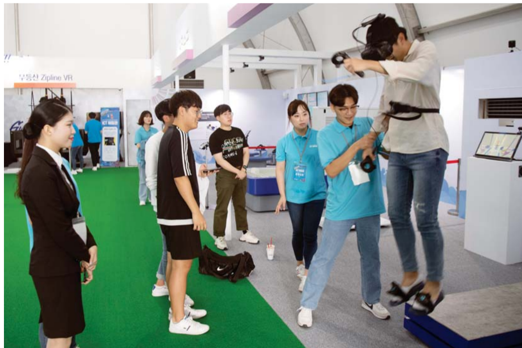
ICT를 찾은 관람객이 VR을 통해 심해 스쿠버 다이빙을 체험하고 있다.

광주의 명소를 기술로 찾아갈 수도 있다. 광주정보문화산업진흥원 부스에서는 관람객들의 탄성을 들을 수 있다. VR로 무등산 짚라인을 타고 허