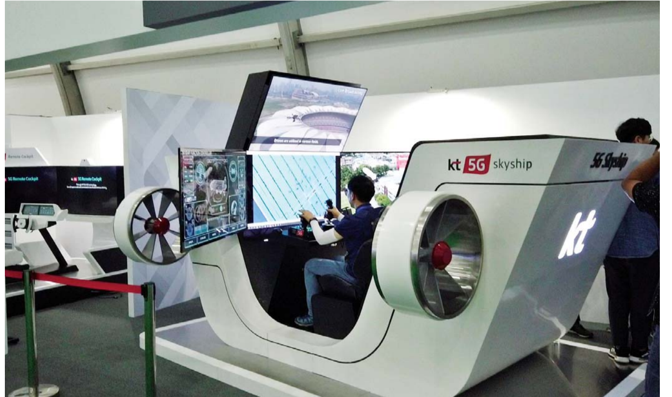
자율주행차량 시뮬레이터에서 5G와 AI기술을 접하는 관람객.