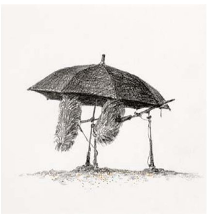
임현채 작 '봄날은 간다'