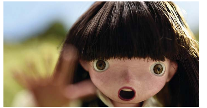
무라타 토모야스 '소나무 가지를 이어'

한편 이번 전시는 롯데백화점 전국 롯데갤러리 10개 점에서 진행되는 아트프로젝트 'LAAP' (LOTTE ANNUAL ART PROJECT) 중 하나로 마련됐다. 올해는 한국영화 탄생 100년을 맞아 키워드를 '영화'로 정하고 공동 주제 'Behind the Scenes'에 따라 다양한 전시를 열고 있다. 문의 062-221-1810. /김미은 기자 mekim@