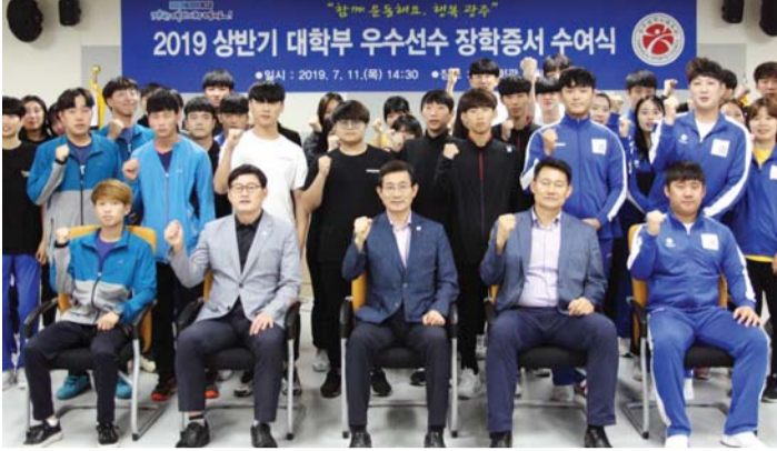
대학부 우수선수 장학금 수여식에 참석한 선수들이 파이팅을 외치고 있다.

광주시체육회는 최근 체육회관 중회의실에서 대학부 우수선수 73명에게 2019년 상반기 장학금을 전달했다.