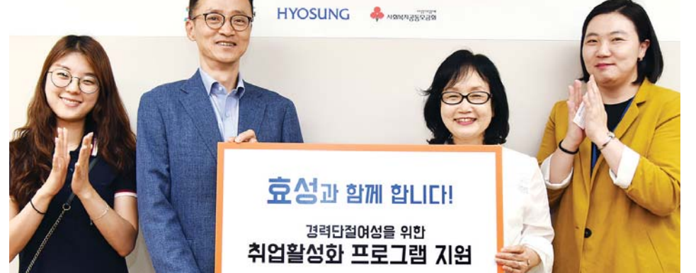
리 창출을 위한 '킴브릿지(떼기 처리되는 컴퓨터 등을 분해해 재활용하는 것) 사업'도 후원하고 있다.