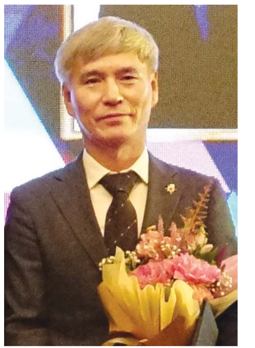
(주)태운 구항회 대표이사가 최근 ‘존경받는 기업인’ 상을 받은 뒤 기념촬영하고 있다.

한편, 중소기업벤처기업부는 존경받는 기업을 포함한 성과공유 기업에 대해서는 정부 정책 참여 시 우대하고 있다. 경영성과급에 대한 법인세 감면 등 세제지원을 통해 성과공유 문화 확산을 지원하고 있다. <김한영 기자 young@kwangju.co.kr