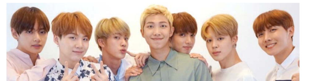
왼쪽부터 뷁, 슈가, 진, RM, 정국, 지민, 제이홉

그들 방탄소년단이 미국 빌보드 ‘소셜 50’ 차트에서 2년여간 정상을 올렸다. 지난 30일(현지시간) 빌보드가 발표한 최신 차트에 따르면, 방탄소년단은 ‘소셜 50’에서 107주 연속 1위를 차지했다. 이는 2017년 7월 29일자 차트부터 이끈 주