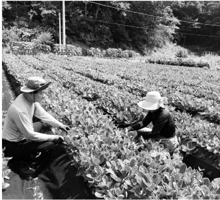
장성의 한 농가에서 농민들이 새로운 약용작물로 각광받는 지황을 재배하고 있다. 경옥고의 원료로 사용되는 지황은 혈당강화와 항균작용이 탁월한 것으로 알려져 있다.