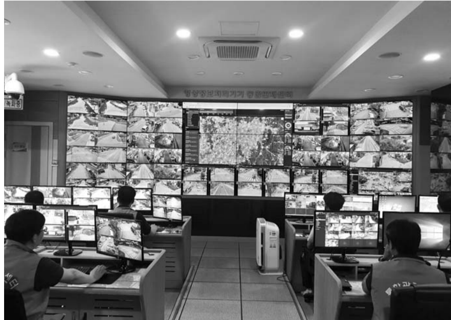
고창군청 4층에 위치한 고창군 CCTV통합관제센터는 지역 내 CCTV 880여 대로 군 전역을 24시간 실시간 모니터링하고 있다. 고창군 CCTV통합관제센터 내부.